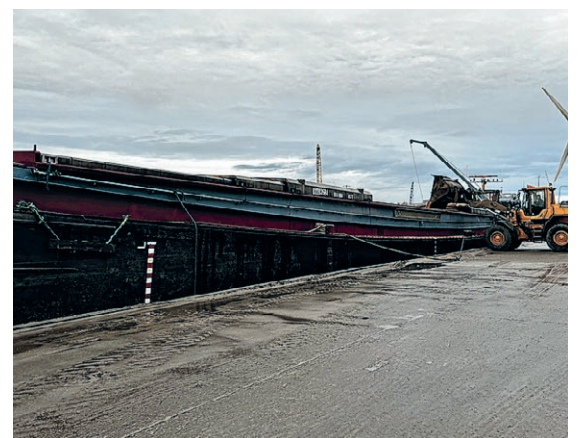
Schip Nova Cura