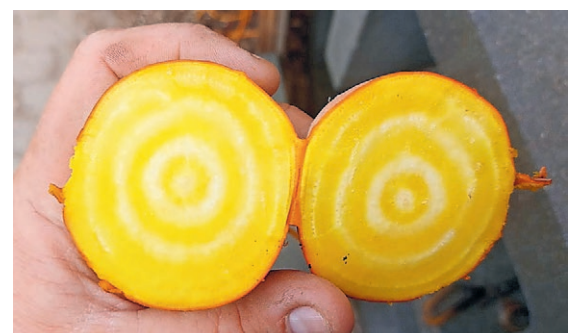
Bieten met de bijzondere ringen