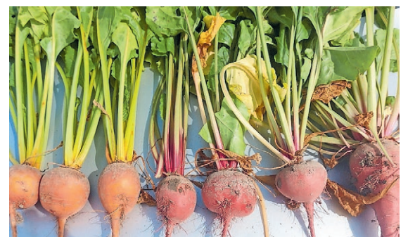
Verschillende soorten bieten