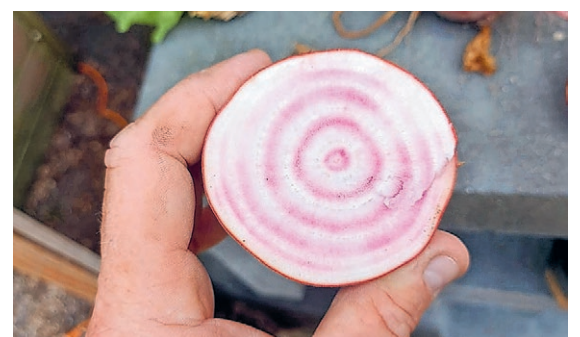
Bieten met de bijzondere ringen

George Pars Graanhandel BV is al meer dan 170 jaar toeleverancier van granen, zaai­zaden, meststoffen en gewas­bescher­mings­producten. Sinds 1850 is het bedrijf al gevestigd op 't Bildt en sinds 2016 ook actief in Flevoland met Poldergraan. Vanuit beide locaties bedienen ze akkerbouwers en veehouders in Fryslân, Groningen en Flevoland, zowel gangbaar als biologisch.